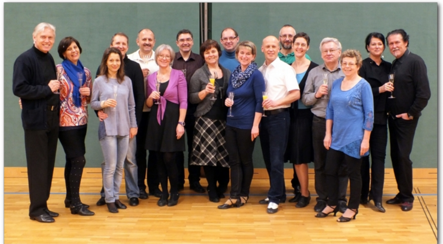
250. Training am 25.01.2015

Am Sonntag, 7. September 2014, konnten wir bei unserem 231. Tanztraining bereits 5 Jahre Übungsgruppe „Tanzen“ innerhalb der Sportunion St. Peter/Au feiern. In den Weihnachtsferien gab es wieder zwei Zusatztermine für das freie Tanztraining, so am Freitag, 26. Dezember 2014 und am Donnerstag, 1. Jänner 2015. Auch am Faschingsdienstag, 17. Februar 2015, gab es wieder ein Zusatztraining.